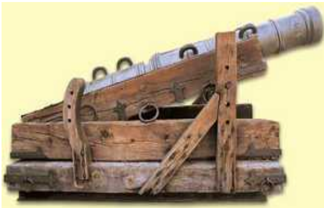
Bombarda alemana del siglo XVI

Conclusión: Las grandes bombardas (que las hubo sin llegar a ser tan monstruosas) se utilizaron en distancias relativamente cortas (100-200 m) y contra objetivos mucho más grandes que un barco, las murallas de las ciudades. Es muy probable que la propuesta se hiciera, pero también es probable que, quienes tuvieran que decidir sobre la misma, se dieran cuenta que era inviable.