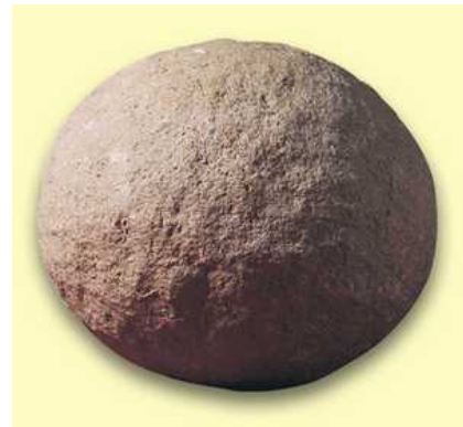
Bolaño de piedra