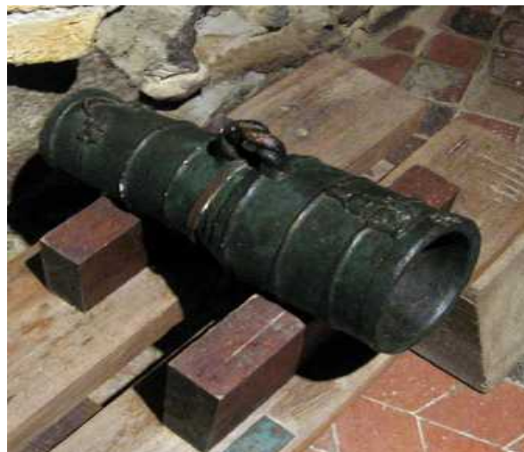
Bombarda del siglo XV