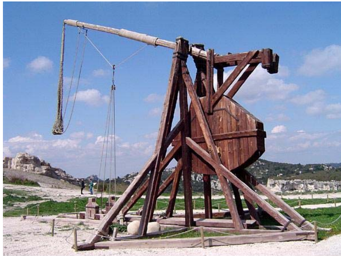
Reconstrucción en el Castillo de Baux - Francia

El trabuquete es un arma que llega a Europa, como otros muchos artilugios, desde oriente. Inventado en China entre los siglos V y III a.C., llega a Europa a través de los árabes, como también es habitual.