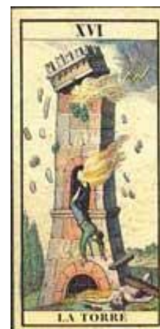
Carta del Tarot

ver con el atentado, que por otra parte, lo lógico habría sido representar mediante dos torres y no una.