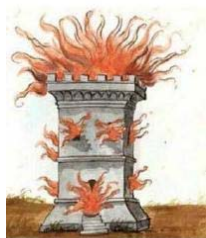
Atribuido a Nostradamus

En época reciente se han encontrado unas acuarelas que le son atribuidas, aunque con ciertas dudas (al parecer no era demasiado hábil en las artes del dibujo y la pintura, lo que pone en cuestión la autoría). En ellas se han querido ver profecías relacionadas con el 11 de septiembre (torres gemelas) y el supuesto próximo fin del mundo.