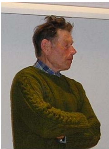
Kaarlo Pentti Linkola

Ahondando en lo anterior, un caso particular de los planteamientos ecologistas es la defensa de los derechos de los animales. En realidad tales derechos no tienen existencia previa, ya que, llegado el caso, es la propia sociedad humana quien los otorga. Cosa diferente es la discusión sobre si esta sociedad debe progresar hacia un modelo que aborrezca la crueldad y sea respetuoso con el resto de las especies, aunque no exista ningún hecho natural determinante que así lo exija.