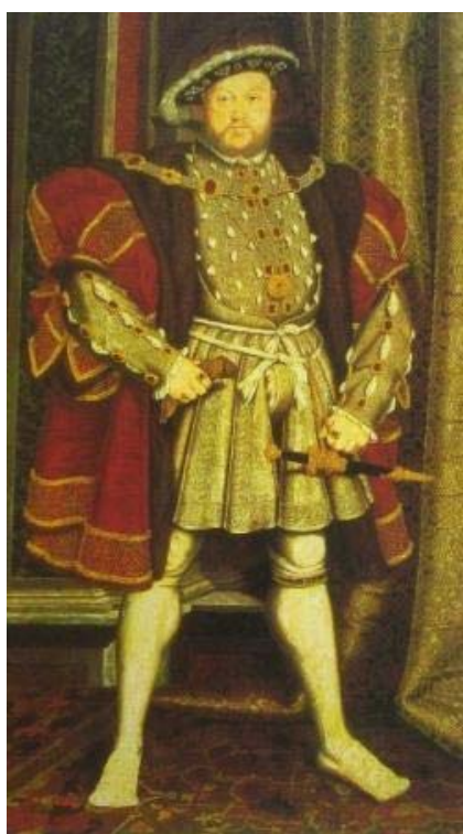
Fijaos como luce Enrique VIII su "agresiva" coquilla

Afortunadamente son más, cada día, las personas que no se dejan esclavizar por los conceptos estéticos de quienes creen estar en posesión de la "verdad suprema" y que deciden vestirse como les sale de sus reales ..... (Poner aquí la palabra que cada uno prefiera).