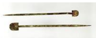
Cauterios de la Antigua Roma

El uso del cauterio, especialmente para la hemostasia (proceso de detención de hemorragias) en amputaciones y heridas, ha estado ampliamente extendido desde la más remota antigüedad. Pero no solo para esta labor se ha utilizado el cauterio, si no que este tratamiento se ha extendido a otras muchas afecciones como es el caso de las caries, por citar un ejemplo. En concreto los llamados "botones de fuego" tuvieron una amplia utilización en infinidad de enfermedades. Eran artilugios, generalmente de hierro, con una terminación en forma de botón (de ahí su nombre) que, calentados al fuego, se aplicaban directamente sobre la piel. El criterio para su aplicación era vario pues, desde la creencia de los "similares", es decir que enfermedades o lesiones que presentaran aspectos parecidos se curaban con los mismos remedios, hasta el criterio de que la reacción del cuerpo a la quemadura activaba la circulación de la sangre favoreciendo la curación. Es por ello que su aplicación fue amplia.