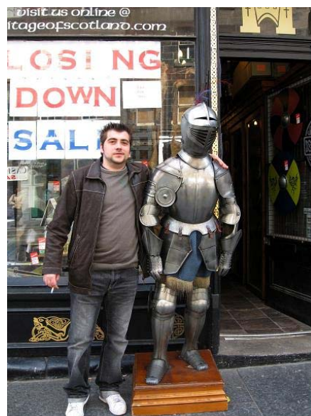
Copia moderna de Armadura Medieval

La armadura completa, metálica, es del siglo XIV y alcanza su máximo esplendor en el XV. Posteriormente ira disminuyendo su uso en el siglo XVI y XVII, para convertirse en únicamente ornamental a partir del XVIII. Durante su vigencia tendrá que enfrentarse al arcabuz y, posteriormente, al